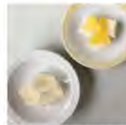
リム付き豆血に琥珀糖 イスタンブールを感じる ヴァクラバを豆血に盛り付け