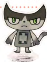
▲ アクリルスタンドメモクリップ ¥1,320(税込)