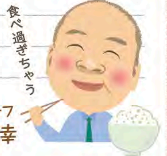
食べ過ぎちゃおう

店名 諏訪市役所食堂 電話 0266-52-4141 住所 諏訪市高島1-22-30 営業時間 11:00～14:00 定休日 土曜・日曜