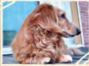
おともだち来るなあ??

みなさんは愛犬のシャンプーはどうしていますか？ 我が家の愛犬Noaは、トリマーさんの予約状況によっては自宅でもシャンプーをするようになりました。芯までしっかり毛を乾かすのに毎回苦戦していましたが「PET用ドライヤー」を使い始めてから時間短縮ができ、毛もサラツヤになったので紹介したいと思います！