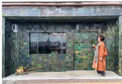
昭和初期に建てられた薬局の名残を残す外観